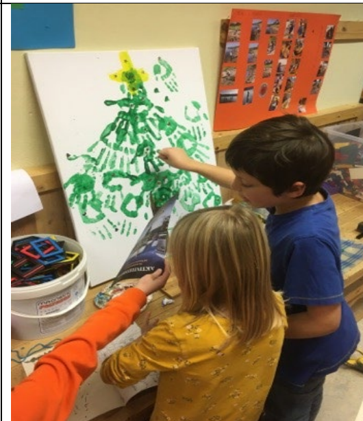
Samarbeid om å pynte treet.