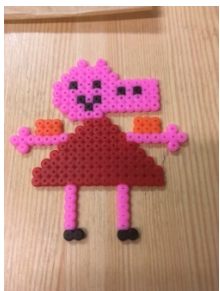
Peppa Gris med armringer!