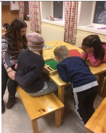
Ungdommer fra «Innsats for andre» spiller spill med elevene, de leker og hjelper til.