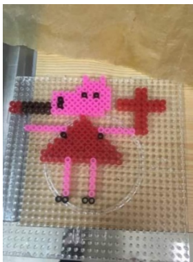
RIP Peppa Gris...